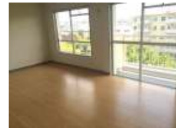
6帖の洋室は寝室にもぴったり