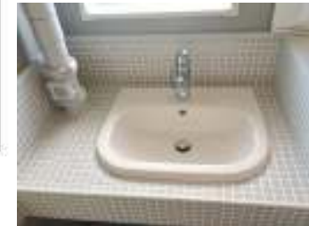
モザイクタイル貼りの洗面台