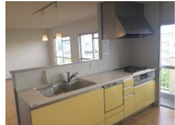
イエローカラーの対面キッチン