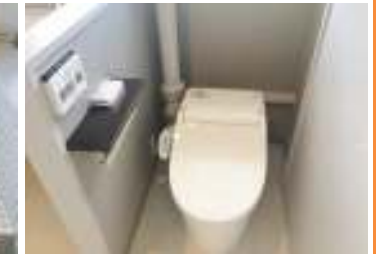
タンクレストイレ